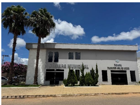
Figura 7 – Na fachada será retirada o ladrilho branco e instalado placa de granito neste mesmo local, reparo na trinca na recepção e plenário, será acrescentado 60 cm de alvenaria na altura da platibanda, remoção e nova pintura em toda a fachada com instalação de placa de inauguração.