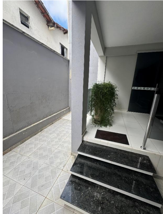
Figura 4 – No espaço entre o patamar e o muro será construído uma sala de impressão, com estrutura de concreto armado, alvenaria, pintura, telhado, de acordo com os projetos.