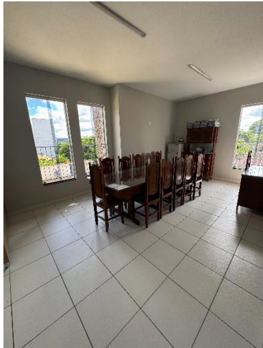
Figura 1 – Construção de divisória de Dry Wall de acordo com o novo layout presente no projeto arquitetônico.