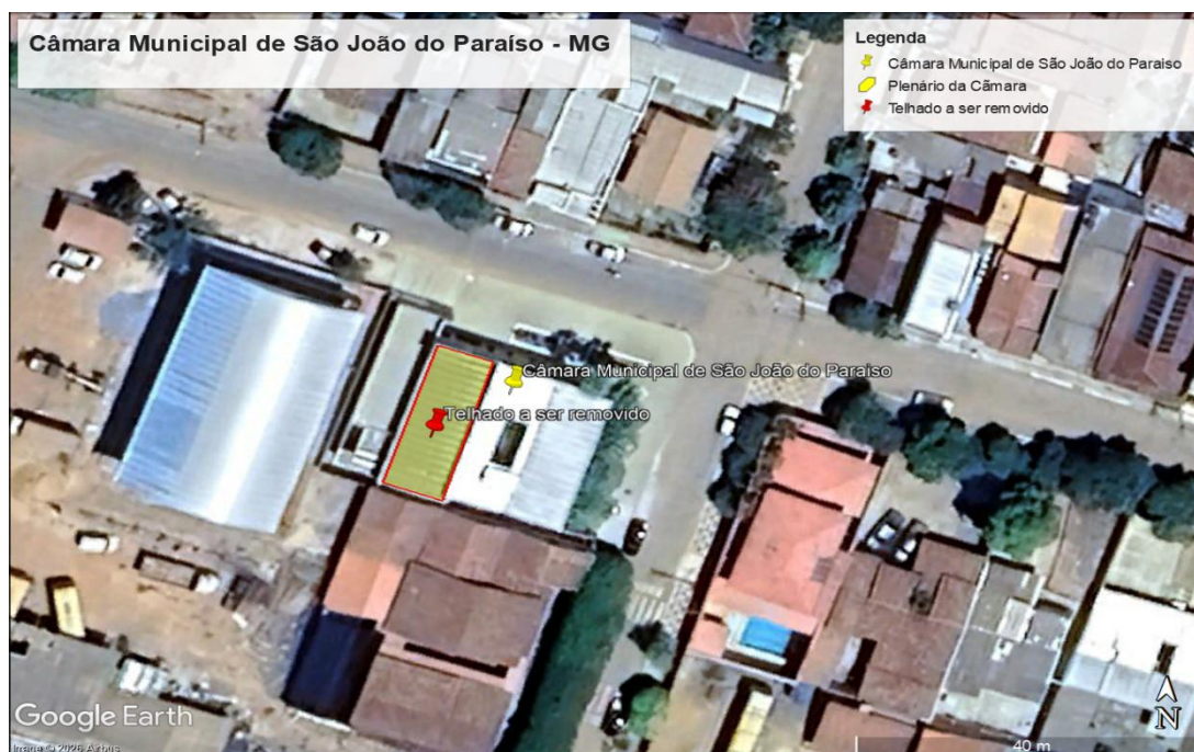
Figura 2 – Estrutura do telhado a ser removida e montada outra no local de acordo com projeto arquitetônico e estrutura metálica.