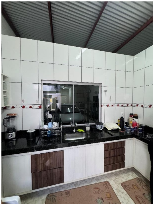
Figura 5 – Será instalado o forro de gesso acartonado e luminária na cozinha.