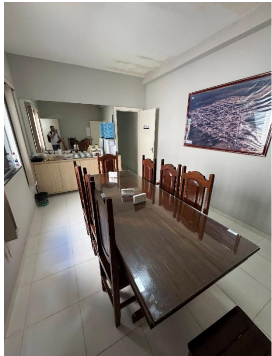
Figura 6 – Na copa será removida a pintura das paredes e teto para uma nova pintura. Deverá ser feita a limpeza das calhas acima deste local.