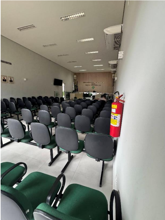
Figura 3 – Forro de gesso e luminárias a serem retiradas para instalação de novos, pintura nas paredes a ser removida para a nova pintura nas paredes e forro.