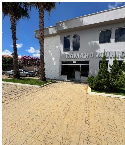
Figura 8 – Será removido os coqueiros e grama para a construção de um espelho d'água com um chafariz com 3 bacias, será removido todas as placas danificadas do piso da calçada e colocado outro novo.